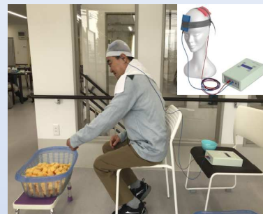
t - DCS