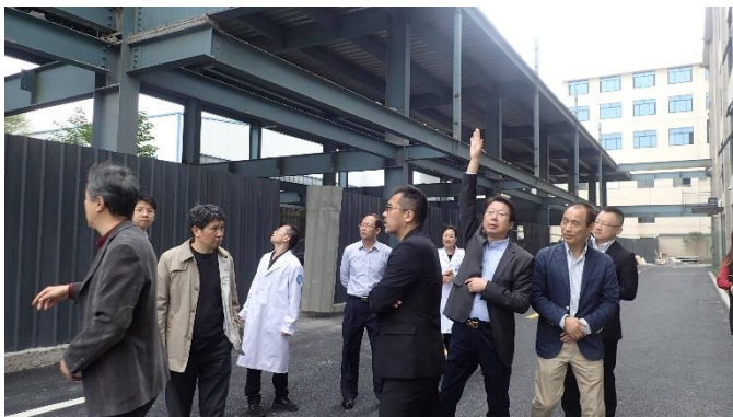
リハビリ室予定地