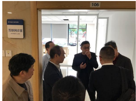
オンライン診療室